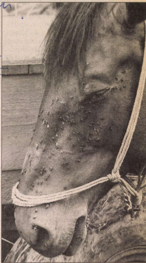
A szerző a Magyar Királyi Csendőr Bajtársi Közösség központi vezetője

Hogy ennek az alaptörvénynek egyenes folytatásaként meghozott és az 1883. évi, május 20-án kihirdetett XXVII. törvénycikk már besorozott honvédeknek csendőrségi szolgálattételre való alkalmazását szabályozza, nem sok kételyt engedélyez, mert ennek a törvénynek második paragrafusa már a HM szerepét is meghatározza: „Az említett években besorozott, a csendőrségi szolgálatra alkalmas, lehetőleg nőtlen honvéd őrvezetők, altisztek és szükség esetén közlegények a honvédelmi miniszter által kiválasztatnak és a csendőrségi szolgálatra behívatnak”.